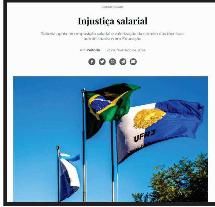
TEXTO DO DOCUMENTO foi exposto na página oficial da UFRJ na internet: apoio institucional fortalece a luta

parlamentares por orçamento e apoio para a valorização da carreira da categoria, ressaltando que ela está na base da pirâmide salarial do Exe-cutivo. O dirigente acrescentou que manifestações semelhantes àquela que ocorria no Consuni aconteciam em outras universidades.