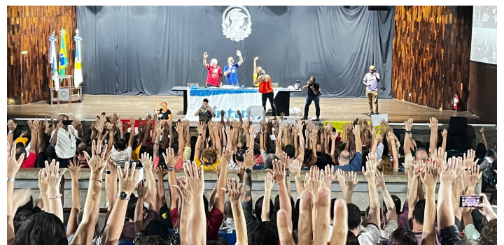
MARÇO 2024. 700 servidores votam pelo início da greve

Outros itens de impacto financeiro e não financeiro são objeto de debate em Grupos de Trabalho Nacional com o Ministério da Gestão e da Inovação em Serviços