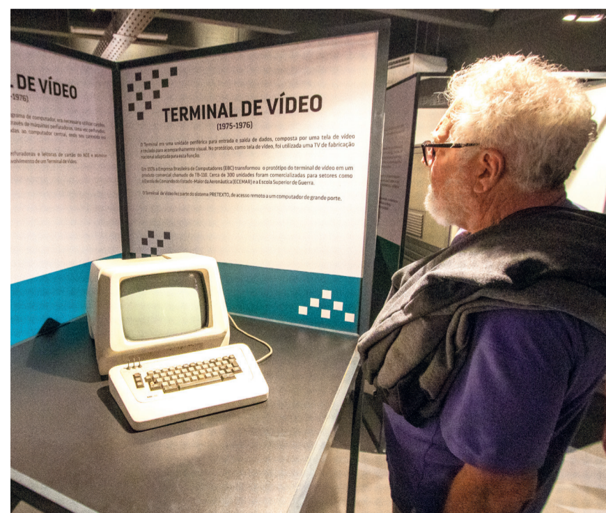
MUSEU RECUPERA imagens ancestrais de equipamentos de informática