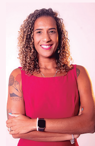
EX-MINISTRA ANIELLE, convidada do GT para falar dos desafios feministas

Entre outros títulos, Anielle é mestra em Relações Étnico-Raciais pelo Cefet/RJ e fundadora do Instituto Marielle Franco.